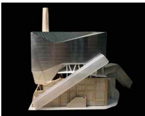
圖 4：尤賀，《風城記憶發電所》。