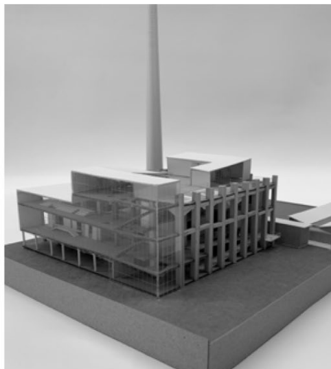
圖 3：張家馨，《Disassemble & Reorganization 六燃當代藝術館》。