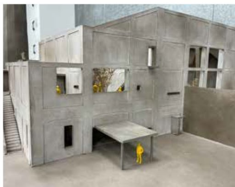
圖 5：黃瑋庭，《遊——發電廠的日常與非日常》。