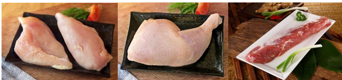
(1)雞胸肉 200 克